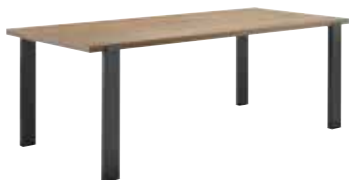
Eettafel L138xB85xH77cm ±98cm 10357948 L160xB90xH77cm ±120cm 10357949