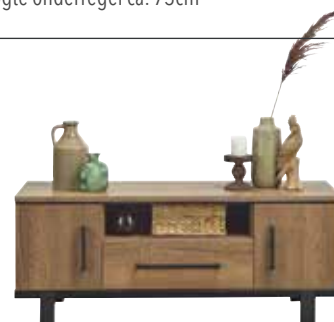
TV-meubel 2 deuren, 1 lade, 1 vak H52xB130xD44cm 10357943 Maat open vak: ±H14xB58xD41cm Open vak voorzien van ronde opening voor kabeldoorvoer