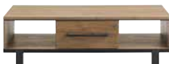
Salontafel 1 lade, 2 vakken L135xB67xH40cm 10357952