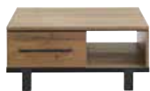
Salontafel 1 lade, 1 vak L90xB90xH40cm 10357953