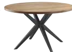
Eettafel Mascaro rond Ø150xH77cm 10357927 Hoogte onderregel ca. 73cm