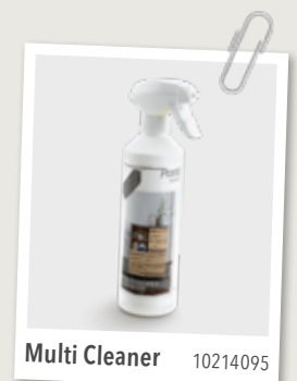
Multi Cleaner 10214095

Alle verzorgings- en reparatiemiddelen die wij in dit boekje hebben genoemd, zijn bij ons verkrijgbaar.