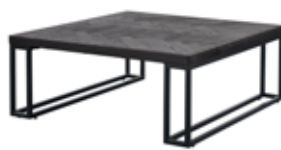
Salontafel (U-poot) L95xB95xH38cm 10335331