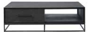
Salontafel 2 laden, 1 vak L124xB70xH37cm 10334968

Hoogte vanaf grond tot onderkant regel is ± 73cm