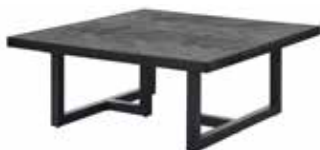
Salontafel (T-poot) L95xB95xH38cm 10335335