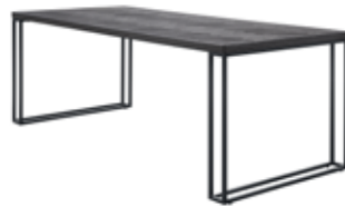
Eettafel (U-poot) L160xB95xH78cm Ruimte tussen poten: ±136cm 10335332 L190xB95xH78cm ±166cm 10335333 L220xB95xH78cm ±196cm 10335334

Hoogte vanaf grond tot onderkant regel is ± 73cm