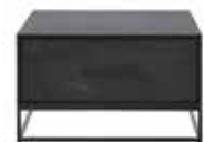
Salontafel 2 laden L65xB65xH37cm 10334967