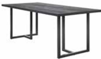
Eettafel (T-poot) L160xB95xH78cm Ruimte tussen poten: ±116cm 10335336 L190xB95xH78cm ±146cm 10335337 L220xB95xH78cm ±176cm 10335338

Hoogte vanaf grond tot onderkant regel is ± 73cm