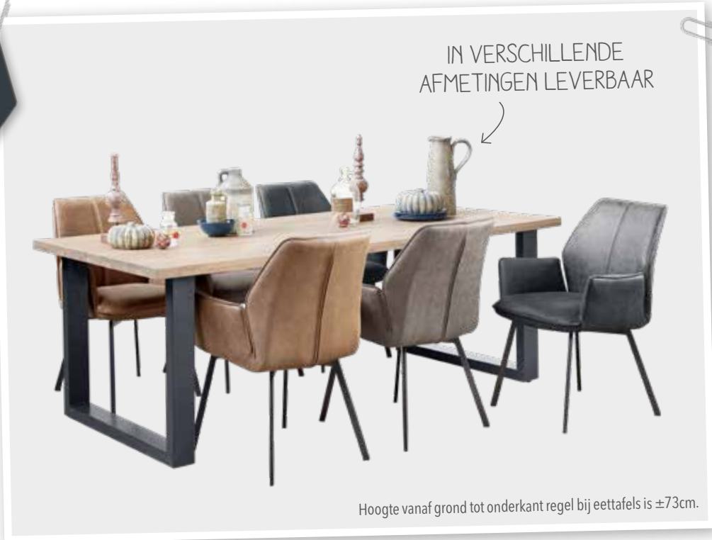
Hoogte vanaf grond tot onderkant regel bij eettafels is ±73cm.