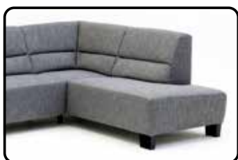
Hoek met eiland links/rechts

Bij sommige elementen kan, afhankelijk van de constructie, een extra stiknaad in de stoffering en/of optisch een extra zitkussen voorkomen. Dit verschilt per model. Op onderstaande foto's is te zien of en waar dit bij dit model het geval is.