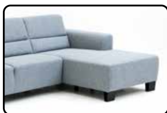
Longchair arm links/rechts