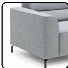
Arm A 21cm.