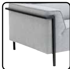
MR1 H15cm zwart (optie)