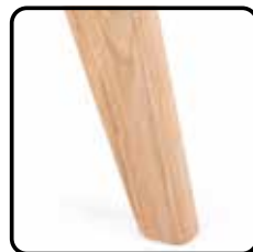
2H1X hout: schuin (optie, geen meerprijs)