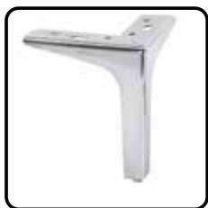
1A6A metaal: recht chroom (optie, geen meerprijs)