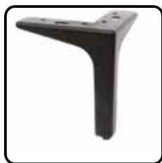
1A6K metaal: recht zwart (optie, geen meerprijs)