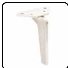
2H4B metaalkleur (standaard)