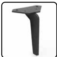
2H4K zwart metaal (standaard)

De metalen poten zijn alleen verkrijgbaar zoals vermeld bij de afbeeldingen.