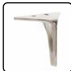
3L8K4 zwart metaal chromkleur (optie, meerprijs)