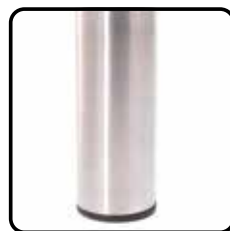
046B metaal geborsteld: rond Ø6cm (optie, geen meerprijs)