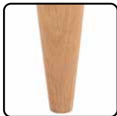
098X hout: taps rond (optie, geen meerprijs)