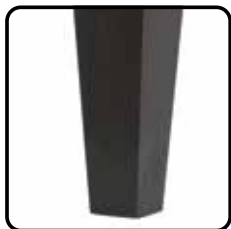
015X hout: taps rechthoekig (optie, geen meerprijs)