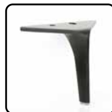
3L8K5 zwart mat metaal (optie, meerprijs)